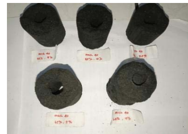
Gambar 1. Sampel Briket

Berdasarkan hasil pengujian, dapat dilihat pada Tabel bahwa ukuran partikel, kadar molase, dan kadar minyak jelantah memberikan pengaruh yang cukup signifikan terhadap karakteristik fisik maupun sifat pembakaran briket limbah kulit durian. Data pada Tabel hasil percobaan menunjukkan adanya variasi nilai panjang, diameter, massa, lama pembakaran, nilai kalor, laju pembakaran, serta penyusutan briket yang terbentuk. Variasi ini erat kaitannya dengan perbedaan perlakuan pada faktor yang dioptimasi melalui metode Response Surface Methodology (RSM).